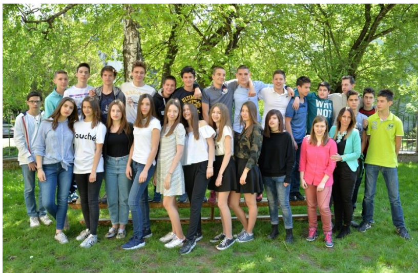
мај 2017. ОШ "ВОЈВОДА РАДОМИР ПУТНИК" VIII 2