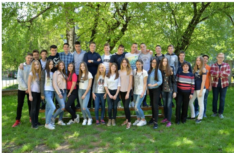
мај 2017. ОШ "ВОЈВОДА РАДОМИР ПУТНИК" VIII 1

Ученици осмих разреда са разредним старешинама и предметним наставницима, прославили су крај осмогодишњег школовања. Свечано обучени за ову изузетну прилику, расположени и насмејани, веселили су се уз пригодну музику, а бројним фотографијама овековечели ове незаборавне тренутке. Остаје нам још да им пожелимо много среће и успеха у даљем школовању и усавршавању.