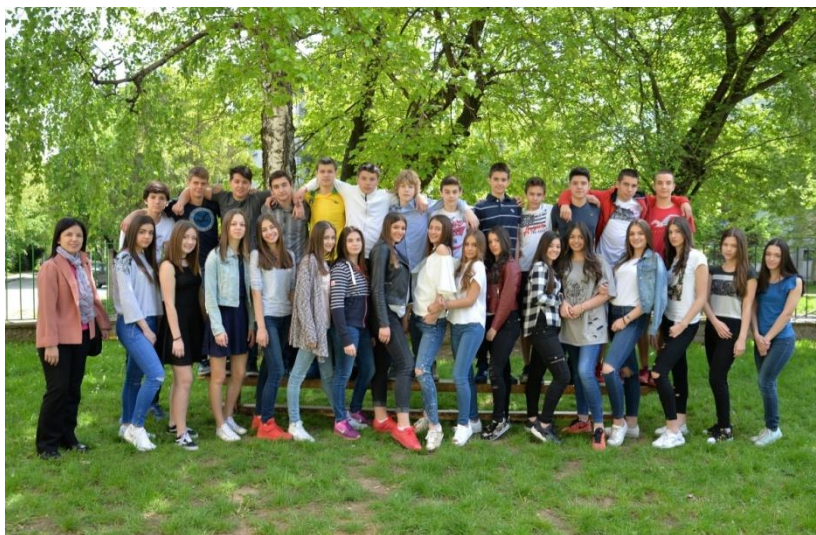
мај 2017. ОШ "ВОЈВОДА РАДОМИР ПУТНИК" VIII 3